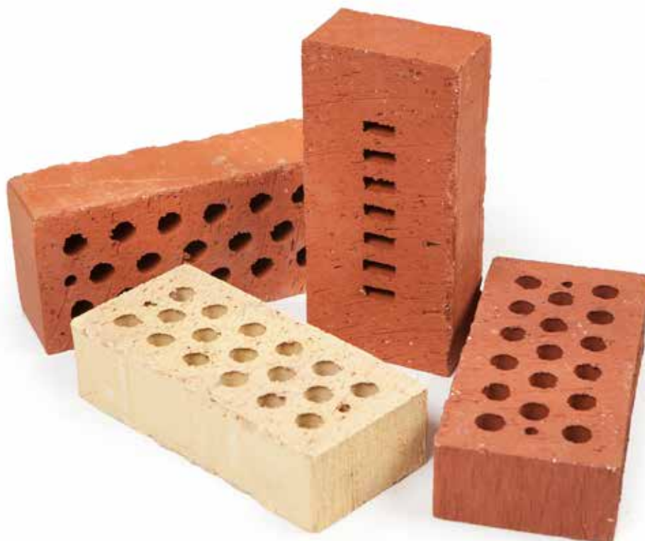
Röd Spånad SNF 19 hål

Övrig tegel- och murverksinfo: se BKR och AMA Hus.