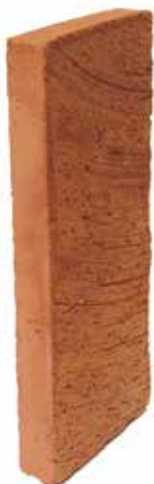
Röd Slät NF 25 MA

Övrig tegel- och murverksinfo: BKR och AMA Hus.