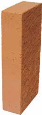
Röd Slät NF 50 MA